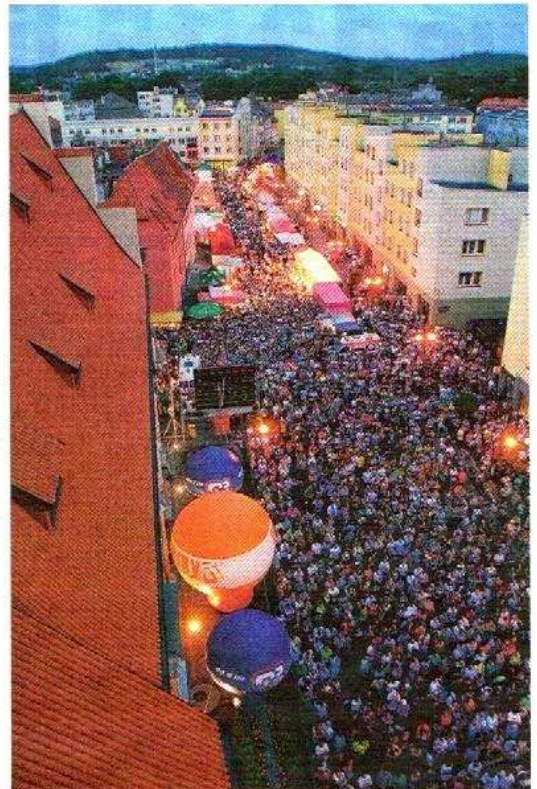
Lwóweckie Lato Agatowe to wielki uliczny festyn z mnóstwem atrakcji.

Wszystkim, którzy wybierają się na Lwóweckie Lato Agatowe, przypominamy, że w czasie trwania imprezy obowiązują zasadnicze zmiany w organizacji ruchu drogowego na terenie miasta, podyktowane przede wszystkim względami bezpieczeństwa. Z ruchu niemal w całości wyłączony zostaje cały teren starego miasta (w obrębie murów obronnych). Wjazd na rynek jest całkowicie zamknięty dla samochodów. W obrębie rynku, gdzie zlokalizowane są główne atrakcje imprezy, poruszać można się wyłącznie pieszo. Na przylegające do rynku uliczki w obrębie dawnych murów obronnych wjechać można tylko przez specjalnie wyznaczone bramy, wyłącznie za okazaniem specjalnych przepustek wjazdowych. Przepustki takie posiadać muszą także mieszkańcy rynku i okolic, którzy zamierzają parkować w tym czasie w pobliżu swoich domów. Przepustki wydawane są przez miejscowy Urząd Gminy i Miasta wyłącznie miesz-