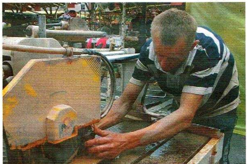
W osadzie walońskiej przez trzy dni imprezy odbywać się będą pokazy cięcia i szlifowania agatów.