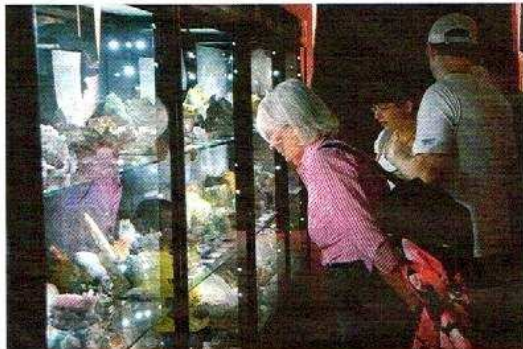
W lwóweckim ratuszu oprócz głównej wystawy tematycznej oglądać można także kilkanaście wystaw kolekcjonerskich.

miasta ze wszystkich kierunków. W tych miejscach najwygodniej jest zostawić samochód. Dojazd do parkingów jest dogodny, nie trzeba stać w korkach, ani krą-